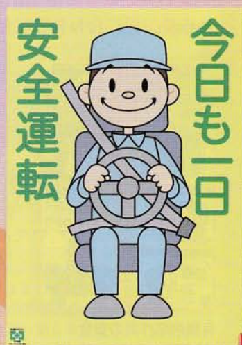
今日も安全運転 210円 申込No.743 B2判 (安全衛生ポスター)