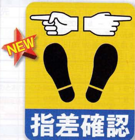
指差確認床シール(両差し) 申込No.820