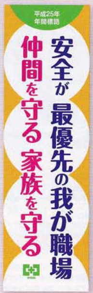
平成25年 年間標語のぼり 2,100円 申込No.786 2.3×0.7m ポリエステル