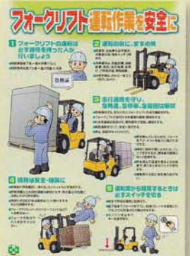
フォークリフト 安全作業 315円 申込No.752 B2判 PP貼り(実践ポスター)