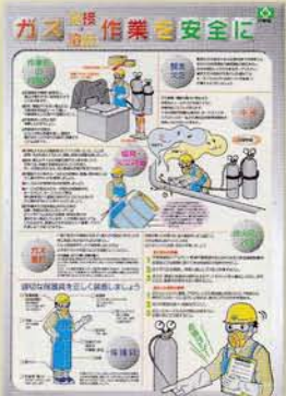
ガス溶接・溶断 315円 申込No.751 B2判 PP貼り(実践ポスター)