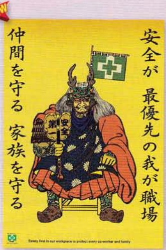
安全が最優先 189円 申込No.754 A2判(緑十字ポスター)