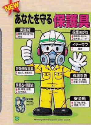
保護具 189円 申込No.745 A2判(緑十字ポスター)