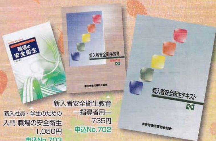
新入者安全衛生教育 —指導者用— 735円 申込No.702 新入社員・学生のための 入門 職場の安全衛生 1,050円 申込No.703