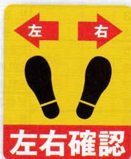
左右確認床シール 申込No.821