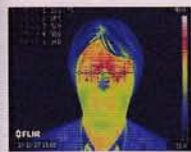
着用10分後のサーモ画像