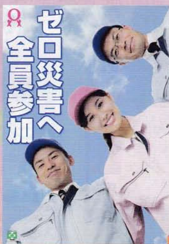
ゼロ災・全員参加 210円 申込No.742 B2判 (安全衛生ポスター)