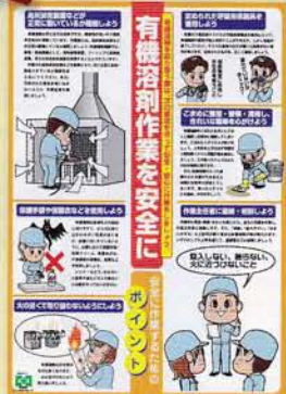
有機溶剤作業の安全 315円 申込No.749 B2判 PP貼り(実践ポスター)