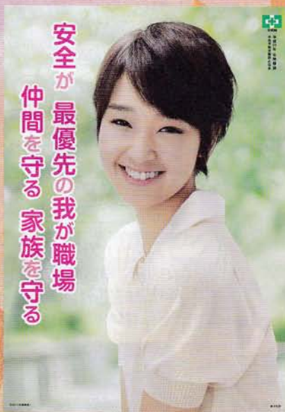
平成25年 年間標語ポスター 315円 申込No.744 B2判