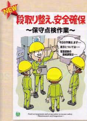
保守点検・安全確保 189円 申込No.746 A2判(緑十字ポスター)