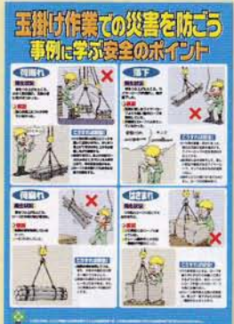
玉掛け 315円 申込No.750 B2判 PP貼り(実践ポスター)