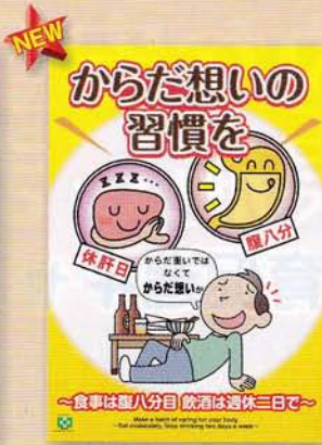
腹八分目・休肝日 189円 申込No.747 A2判(緑十字ポスター)