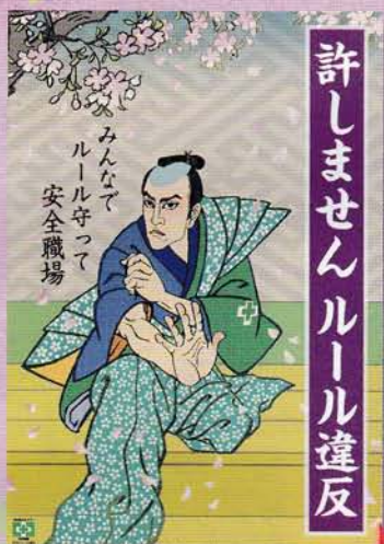
ルール違反 210円 申込No.741 B2判 (安全衛生ポスター)

労働災害の発生件数は平成22年、23年と2年連続で増加し、平成24年も同様に憂慮される状況にあります。このため、厚生労働省から労働災害による犠牲者をこれ以上出さないとの強い決意のもと、「安全衛生管理体制の充実」、「効果的な自主的安全衛生活動の実施」及び「個々の労働者の状況に即した効果的な安全衛生教育の実施」について、改めて総点検するなどの企業の一層の取組について緊急要請がなされています。中災防では、新入社員や人事異動による作業内容が変わる人も特に多いこの時期に、「安全衛生教育」の促進を提案し、その確実かつ効果的な実施に役立つさまざまな図書・用品・ポスターを準備しております。また、安全衛生管理体制の充実や自主的安全衛生活動への支援等も行っておりますので、ご利用いただきたくご案内申し上げます。