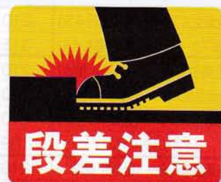
段差注意床シール 申込 No.822