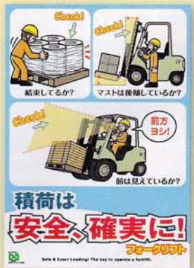
フォークリフト・積荷 189円 申込No.753 A2判(緑十字ポスター)

ポスターサイズ: A2判サイズ: 594 × 420 mm B2判サイズ: 728 × 515 mm